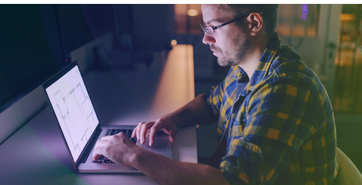
Anomalien in Echtzeit erkennen und Angriffe abwehren

Mit AI-, Data-Analytics- und Threat-Intelligence-Funktionen baut cognitix Threat Defender eine zweite Verteidigungslinie hinter der Perimeter Firewall im Netzwerk auf. So ergänzen Sie Ihre Firewall-Lösungen, die den Datenverkehr an den Schnittstellen kontrollieren und sichern, mit zukunftsweisender Technologie.