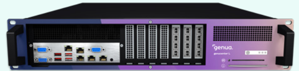
genucenter ist als virtualisierte Lösung und als Racksystem erhältlich

Ergänzend ermöglicht genucenter die Erfassung von Log- und Statusinformationen sowie Echtzeitstatistiken für einzelne Systeme. Zur Integration in bestehende Monitoring-Systeme stehen verschiedene Schnittstellen zur Verfügung.